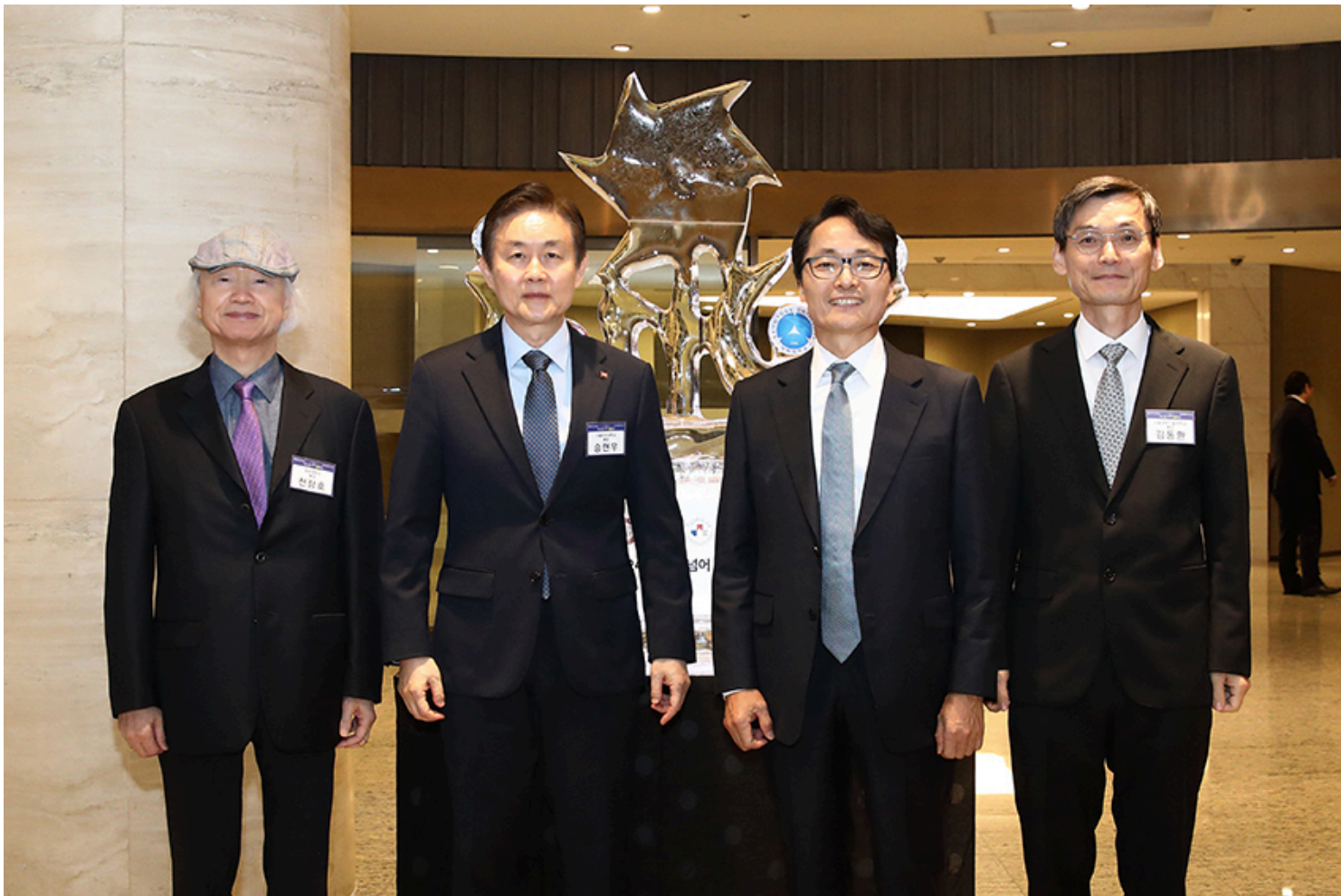
(외좌부터) 과운대 최자승 초자 서울여대 스텔라 초자 삼육대 제세조 초자 서울과기대 기도하 초자